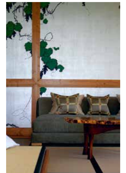
La habitación Shogun es de inspiración oriental. El artista japonés Takeo Hanazawa vino desde Japón y se instaló en la viña durante dos meses para pintar su obra directamente sobre los muros.