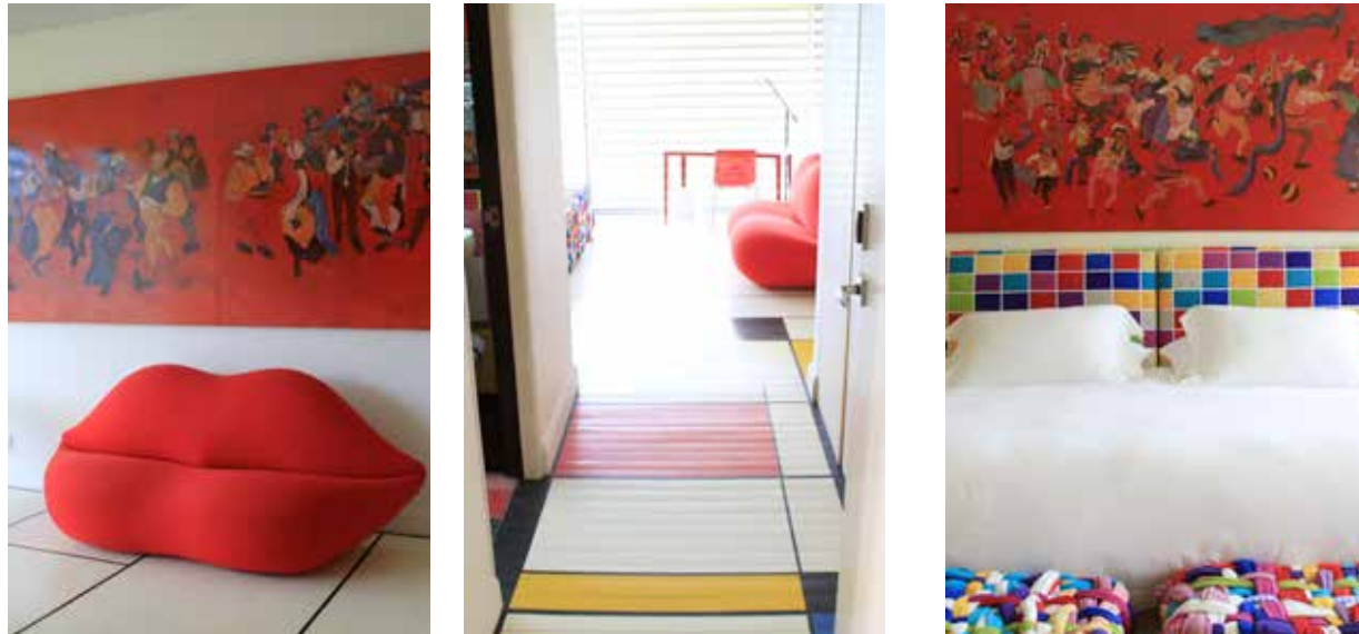
Tanto el baño como la habitación están inspirados y muy bien interpretados en el modernismo de Mondrian.