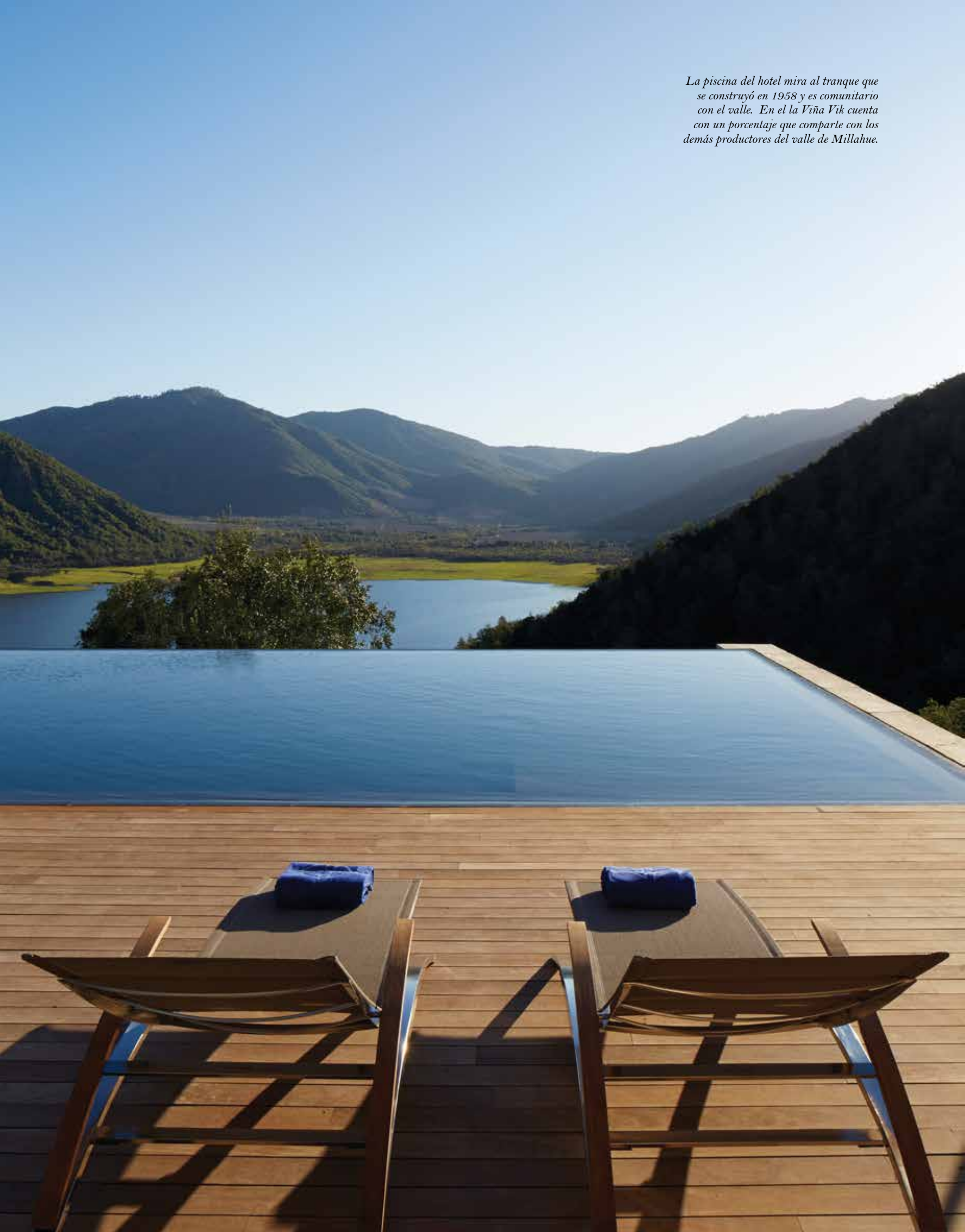
La piscina del hotel mira al tranque que se construyó en 1958 y es comunitario con el valle. En el la Viña Vik cuenta con un porcentaje que comparte con los demás productores del valle de Millahue.