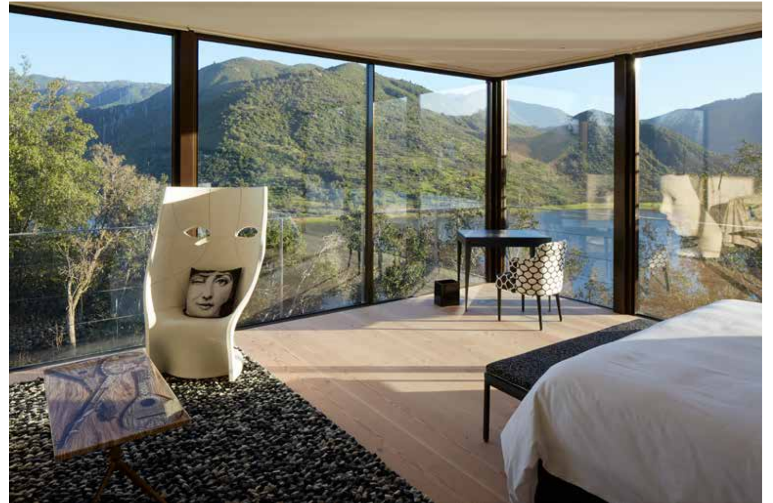
La pieza Fornasetti está inspirada en el famoso creador italiano de muebles y objetos de decoración. Es una oda al diseñador y dialoga en armonía con la naturaleza y la intimidad del jardín zen que está bajo sus ventanas.